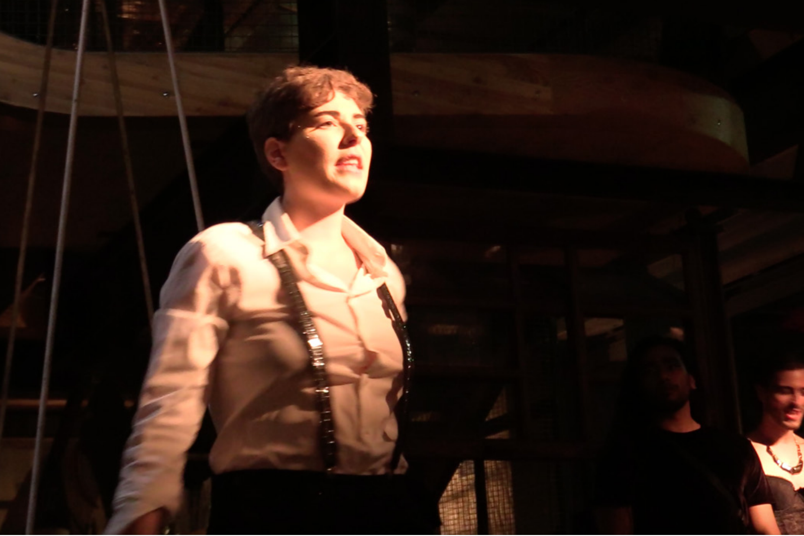
Gloria , performance, 2018.

Performance de lip sync réalisé au sein du collectif Les enfants de dianne aux Magasins Généreux à Paris.