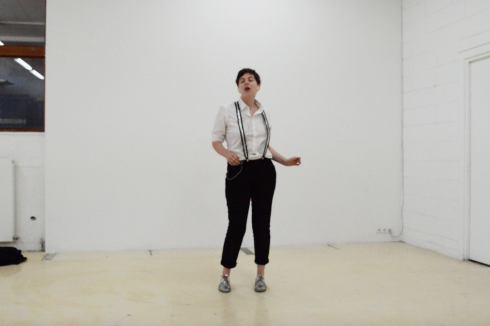
La bouche de Patti , performance, 2018.

Performance de lip sync où seul le performeur entend la chanson, ici Gloria (Horses, 1975) de Patti Smith.