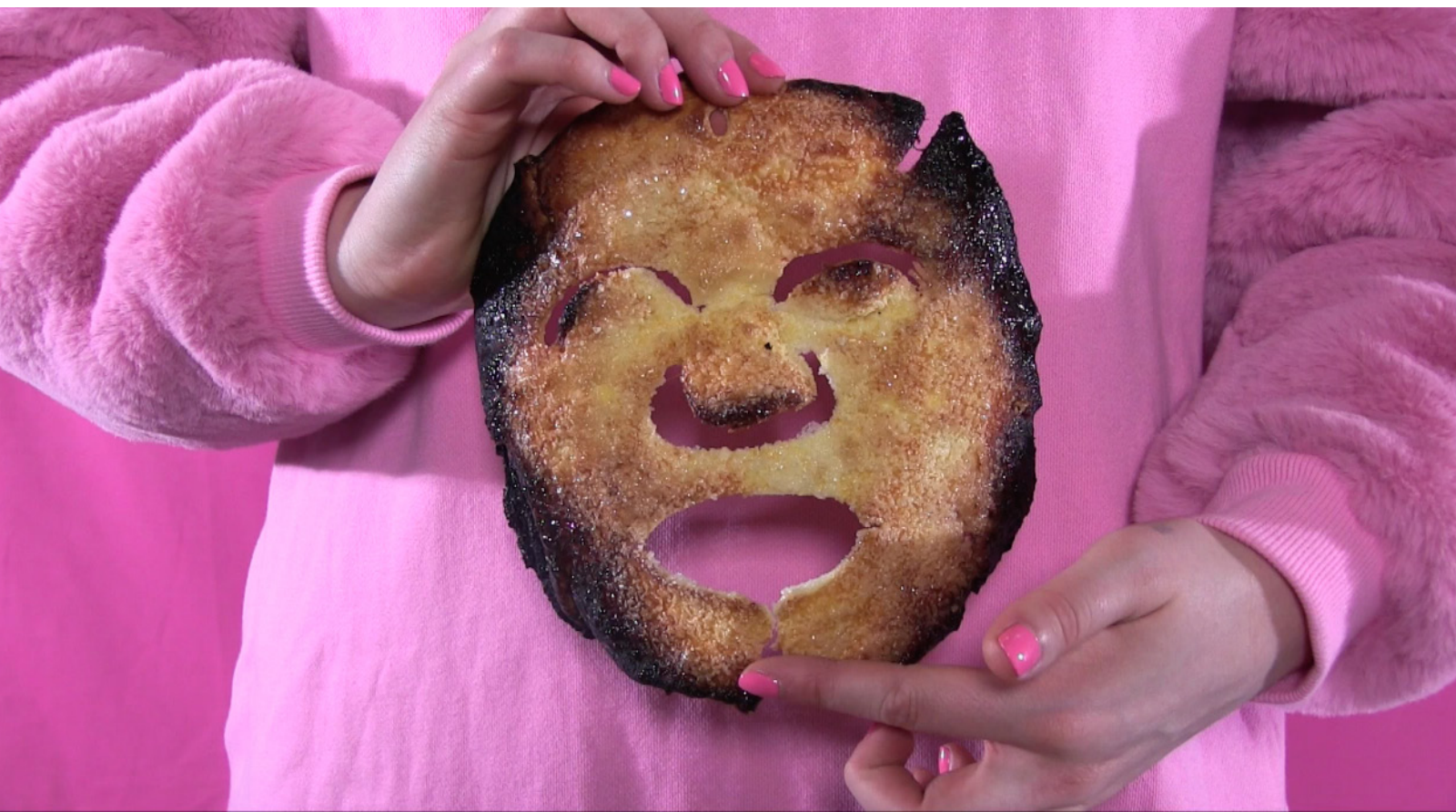
Too Faced , 5'12", vidéo, 2018.