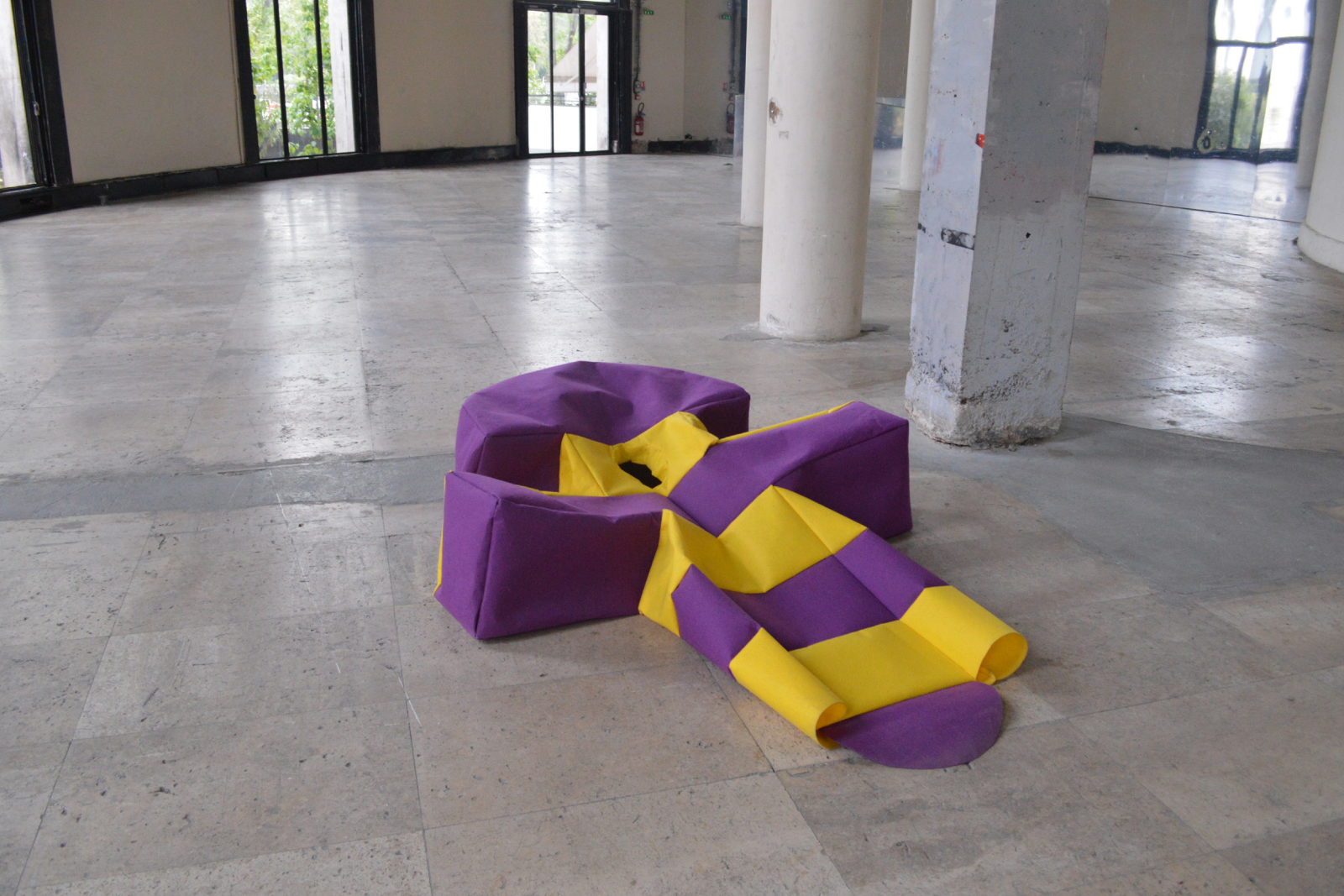
La marelle à DO DISTURB 2017.