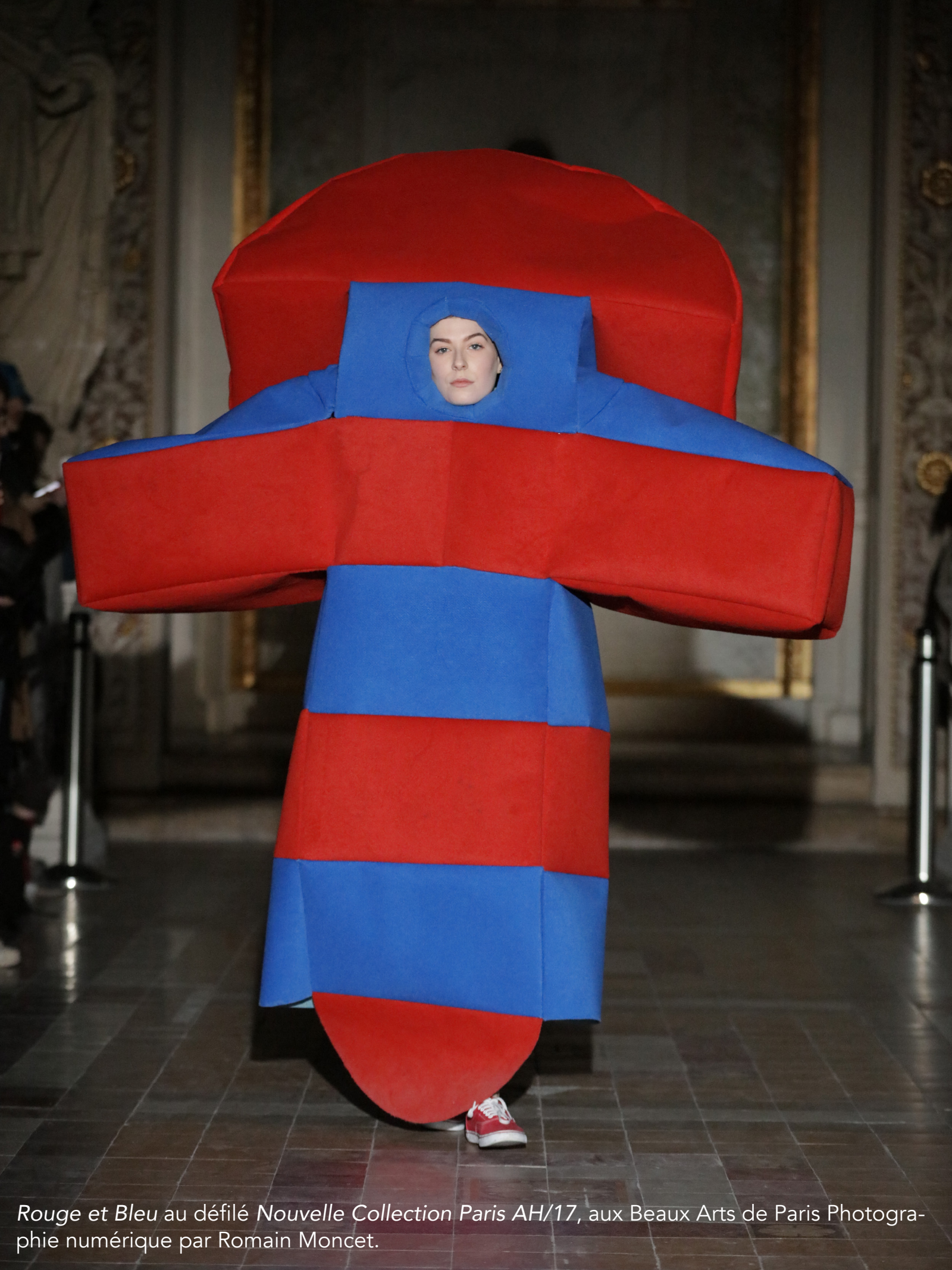
Rouge et Bleu au défilé Nouvelle Collection Paris AH/17 , aux Beaux Arts de Paris