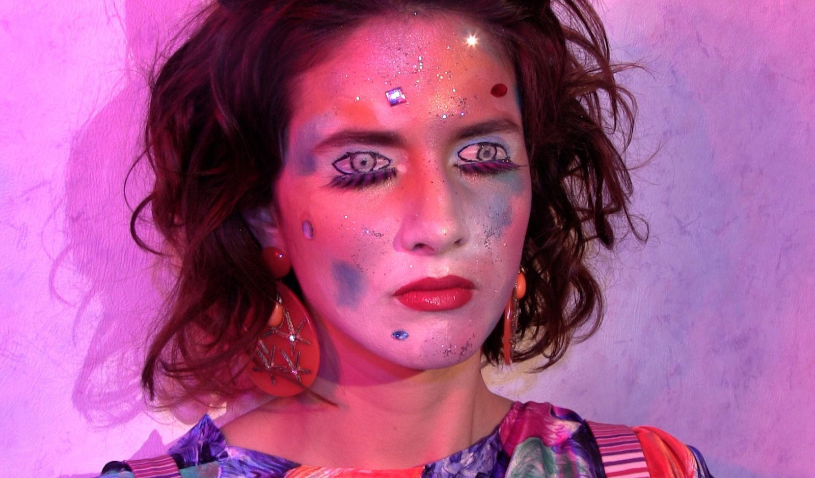
Grégoria-Stéphanie , image du film scène finale 2018.