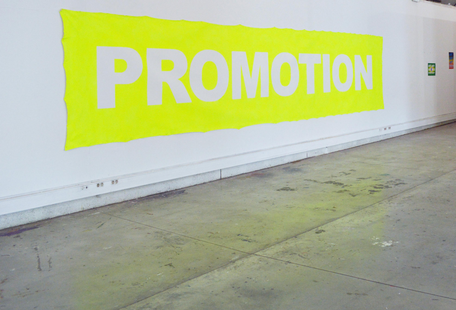
PROMOTION , 600x80cm, toile de coton et acrylique, 2016.