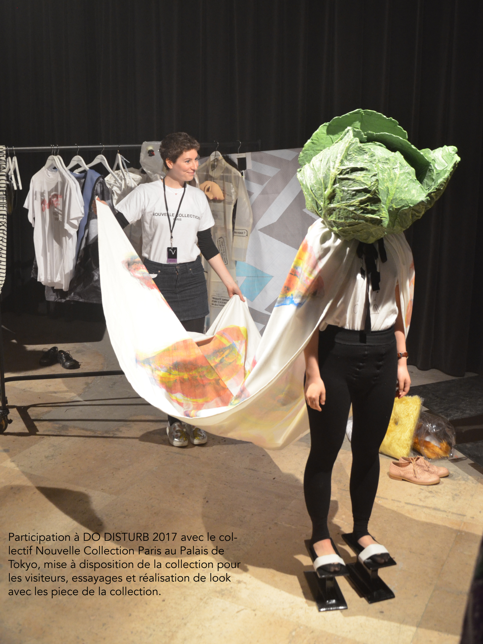
Participation à DO DISTURB 2017 avec le collectif Nouvelle Collection Paris au Palais de Tokyo, mise à disposition de la collection pour les visiteurs, essayages et réalisation de look avec les pièces de la collection.