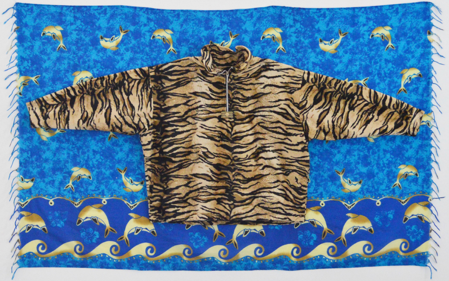
Correspondance, 170x90cm, polaire tigré, paréo dauphin, 2016.