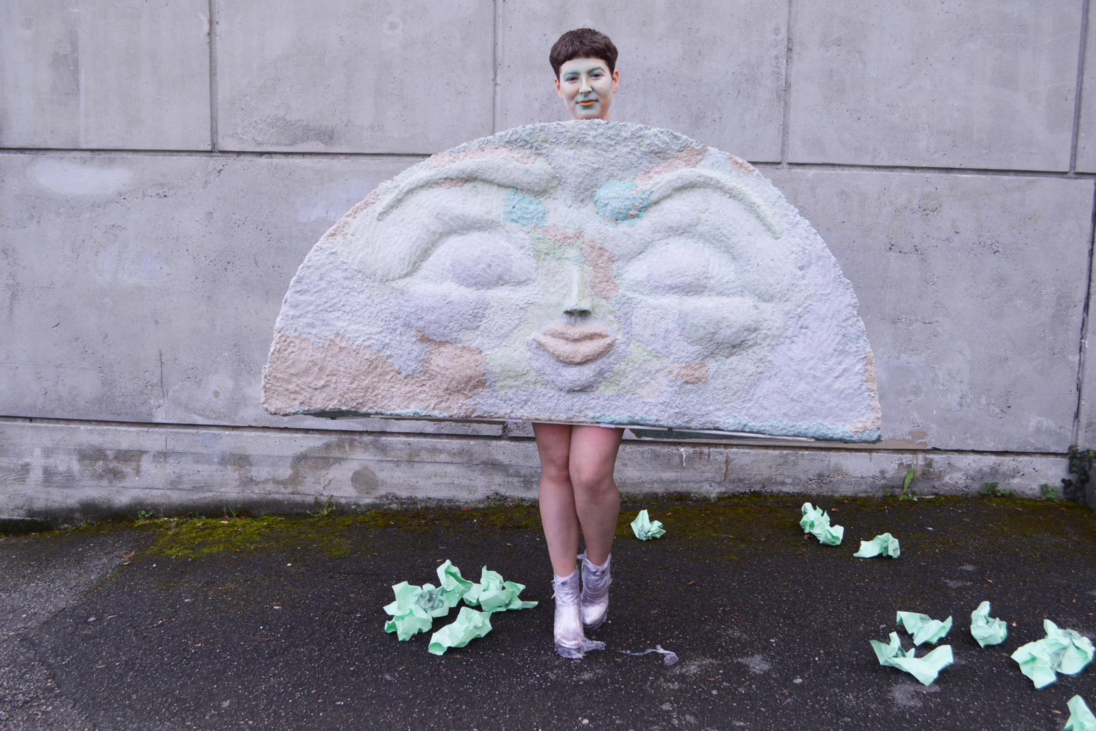
Georges , 165x85x40, carton bouillie, plâtre, cellophane, collant résille, maquillage, éditions, 2019.