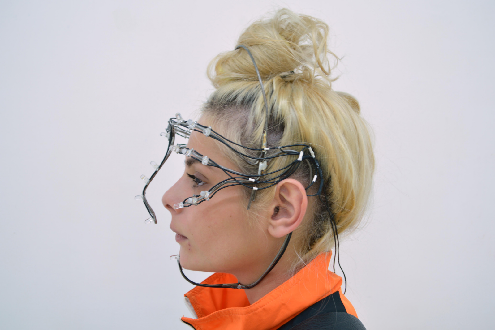
D'el , dimensions variables, étain, LED, système arduino, 2018.

Sculpture de baguettes d'étain serti de LED qui s'allume à chaque pas du performeur detectable grâce à des capteur de force placés sous ses pied. Les LED sont disposé à a façon d'un strobing, technique de maquillage qui structure le visage par la lumière.