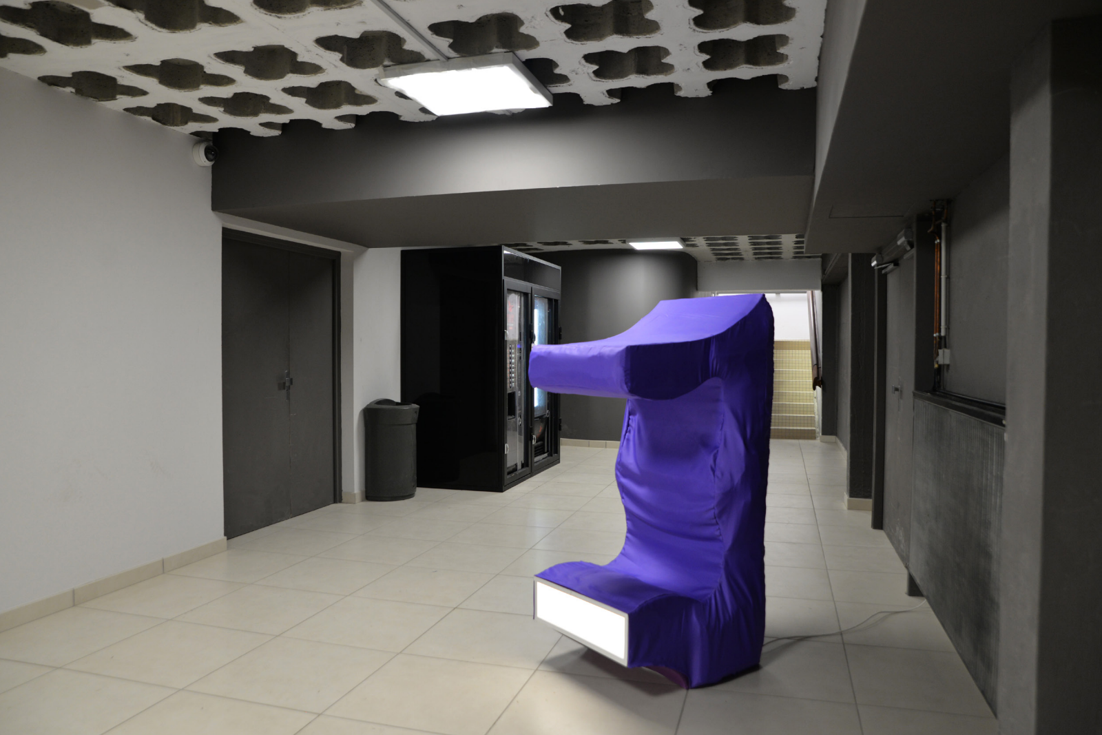
Habillé pour , 00x00x00 cm, satin de polyester, mousse, 2018.

En collaboration avec le duo de designer Studiotec, Habillé pour est une sculpture de tissus et de rembourage réalisée sur les mesures et dans la carnation de l'espace d'accrochage mobile Tous ces angles . Ce vêtement modèle et personifie la perception visuelle de la structure préexistante.