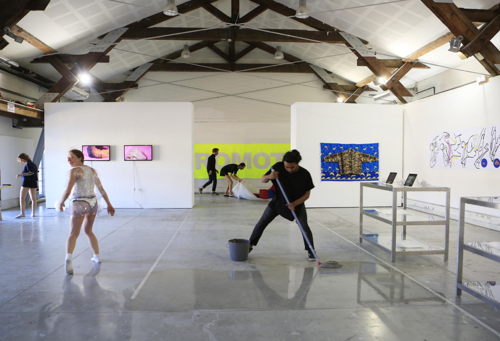
DNA en 2018, vue d'ensemble, réalisation d'un catwalk d'eau et ce cirage pour béton.